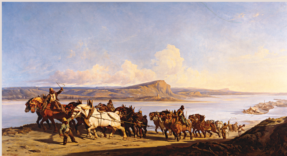
Claude-Alexandre Dubuisson Attelage de chevaux, faisant le service des remontes de bateaux sur le Rhône (vers 1840).