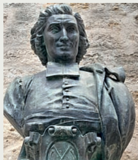
Buste en bronze du sculpteur Henri Varenne (1884). Square de l'église Saint-Roch, Montpellier.