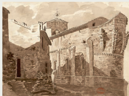
Jean-Marie Amelin, église de Castelnaud, 1829. (Médiathèque Zola, Montpellier).